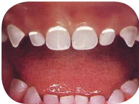
Les lignes blanches le long de la limite gingivale peuvent signifier qu'une carie dentaire est en train de se former. Consultez un dentiste, un thérapeute dentaire ou un professionnel de la santé.