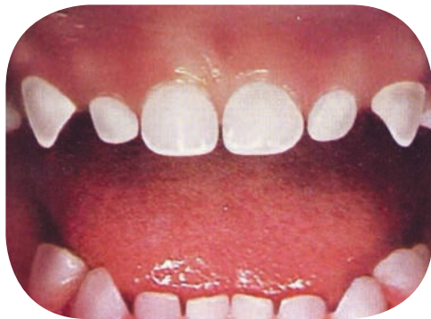
Des dents en santé